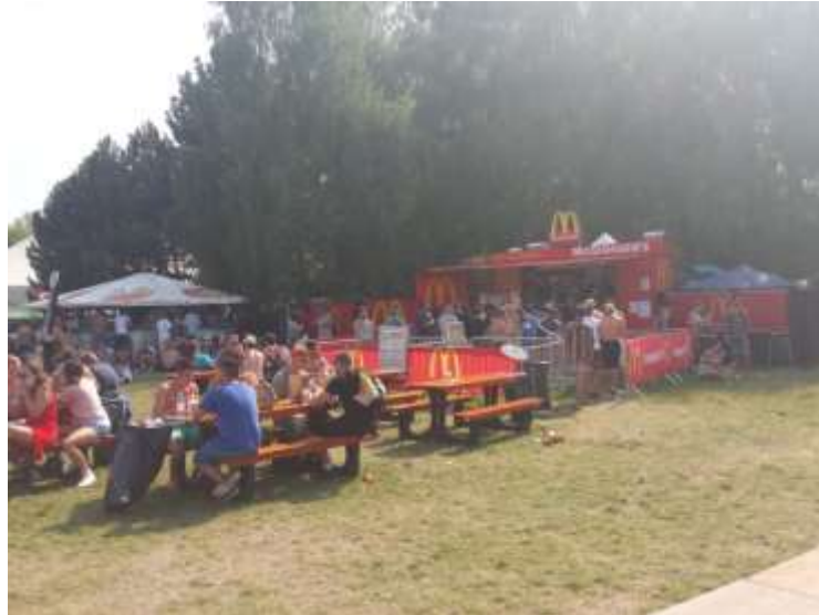
„McDonald's az van!”

A másnap még nem a teljes asszimiláció napja. A felderítés is mondhatni még csak most kezdődik igazán. McDonald's az van!