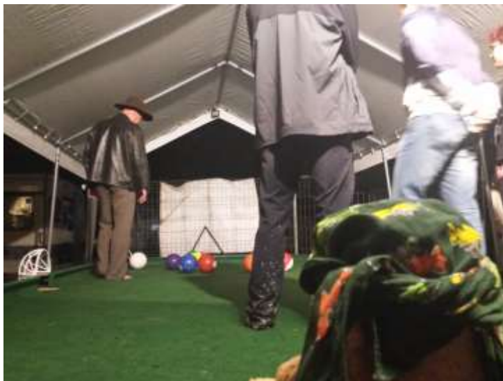
„...felfedeztük a lábbiliárdot...”

Innen a VIP részleghez mentünk. Párszor már betévedtem ide, így láttam már a nappali és az éjszakai arcát is. Alapvetően sziget a Szigeten. A pucc és a celeb úgy jöhet szigetelni, hogy valahol teljesen máshol van, és nem lesz koszos. Itt is jó, csak máshogy. Sok híresnevezetességet lehet itt felfedezni. (Zenészek, médiások, sportolók, politikusok stb.) Puccos helyek pultjai üzemelnek, és extrém puccosak a WC-k is. (Legalábbis így a negyedik napon a többi toitoi-hoz képest.)