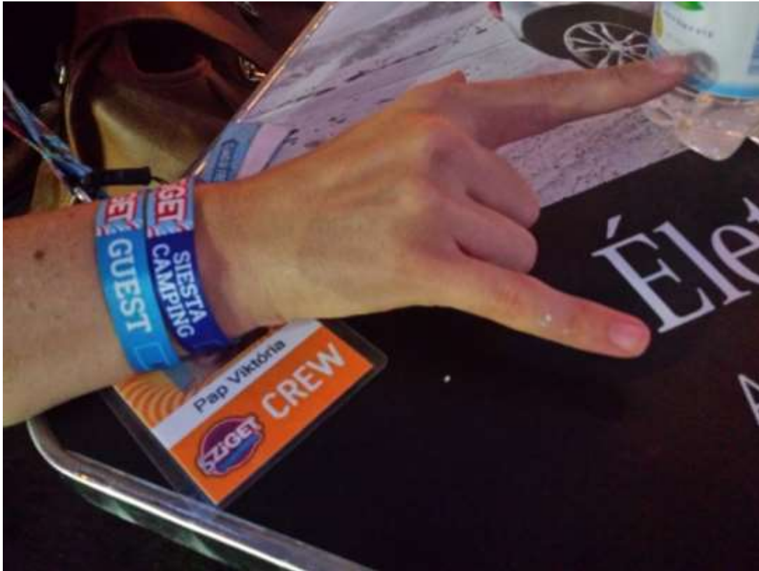
„A crew pass...minden kaput kinyit.”

A crew pass viszont (és egyben az, hogy magyar vagyok) már a második nap világos, hogy minden kaput kinyit. Mondjuk extra kötelezettségekkel is jár, mert többször is előfordul egy nap, hogy megszólítanak különböző segítségkérés miatt. Például merre van a Magic Mirror (véletlenül pont tudom), vagy hadd telefonáljon már a telefonomról, mert lemerült (...) és elveszítette a többiekét ésatöbbi.