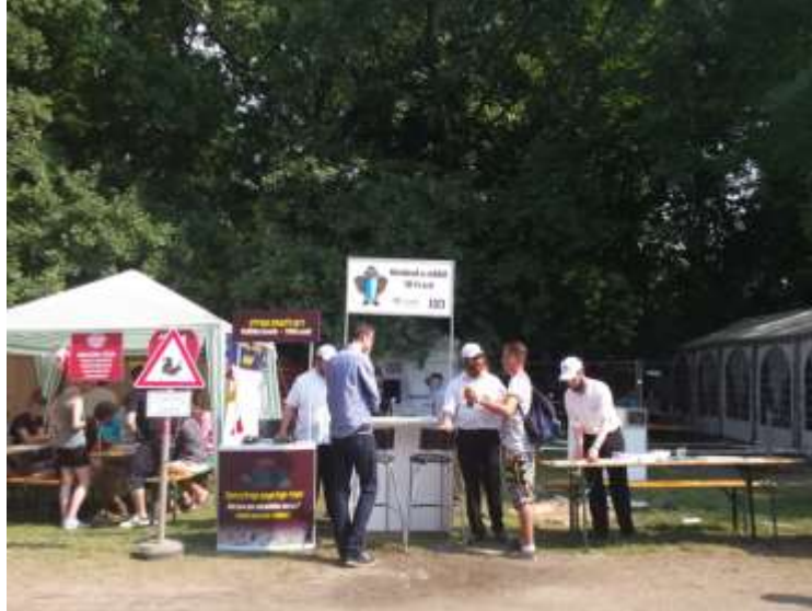
„Kérdezd a rabbit 10 Ft-ért”

Miután elállt az eső az egyik sátorban tartottunk egy konstruktív “linguistic landscape” megbeszélést négyen-öten. Érezhetően áradt a szeretet. Hiszen ez már a negyedik nap.