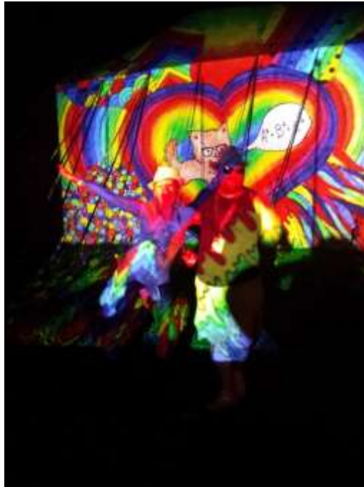
„A Magic Mirror és ami mögötte van”

A hely felfedezése után már nem számítottam semmi újra, szokatlanra vagy meglepőre. Aztán bebocsáttatást nyertem a sátor kordonokkal elzárt háta mögötti extrém titkos, zártkörű, kicsit illegál hangulatú különbulijába. Na, ez az az egyik élményem, amit még fél évvel a történte után is úgy érzek, hogy nem tudom leírni. Filmszerű jelenetek következtek, amiben én voltam a narratív főszereplő. Láttam a főcímet is: „A Magic Mirror és ami mögötte van”.