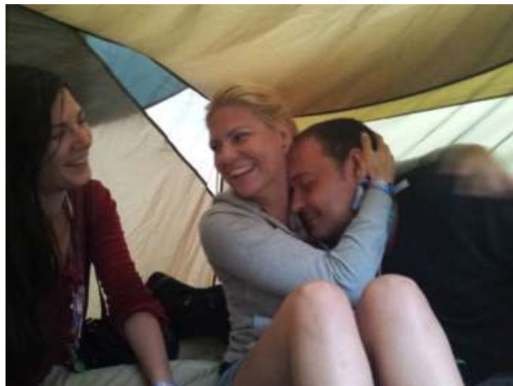
„...áradt a szeretet.”

Miután elállt az eső az egyik sátorban tartottunk egy konstruktív “linguistic landscape” megbeszélést négyen-öten. Érezhetően áradt a szeretet. Hiszen ez már a negyedik nap.