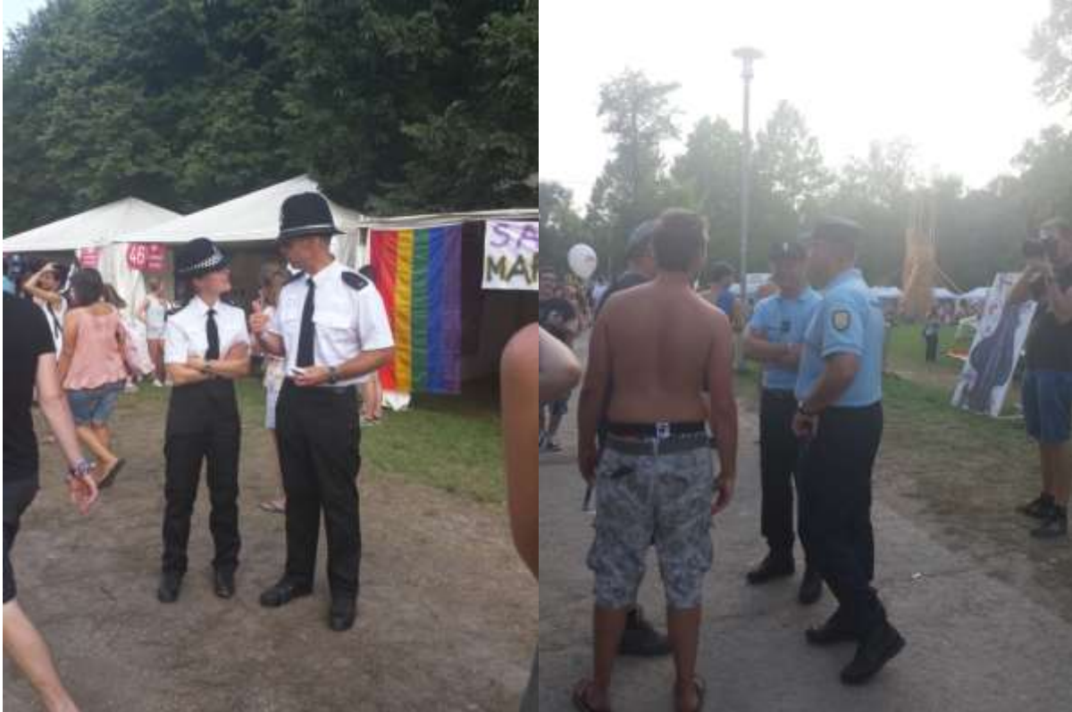
„Jól illeszkedtek a fesztivál jelmezbálos hangulatához.”